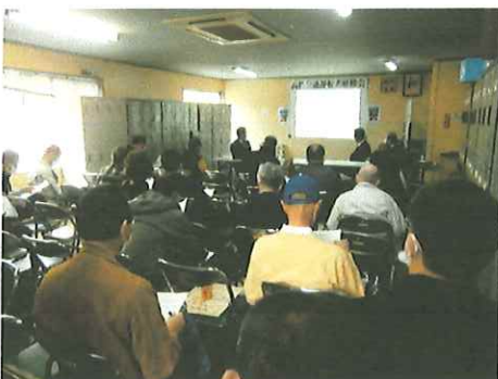
運転者に対する安全研修会