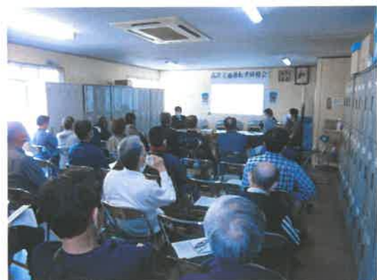
運転者に対する安全研修会

運輸安全マネジメントに関する基本的な取り組みに関する監査の実施と改善に向けたフォローアップ